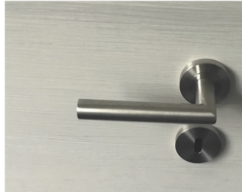
Türdrückergarnitur für Innentüren Ravenna Standard mit Rosette, Edelstahl matt