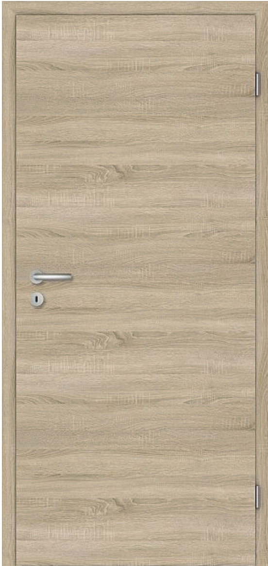
Abbildung zeigt Oberfläche Cepal Authentic Eiche für Wohnungseingangstüre und Zimmertüre. (Drückergarnitur auf Türabbildung nur Beispielhaft).